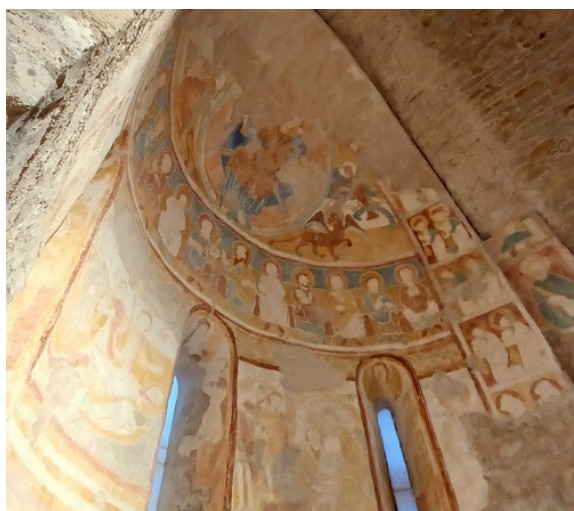
Pintures a l'absis de Sant Pau de Fontclara (Palau-Sator)